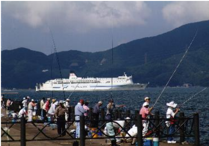
観光協会賞 「就 航」