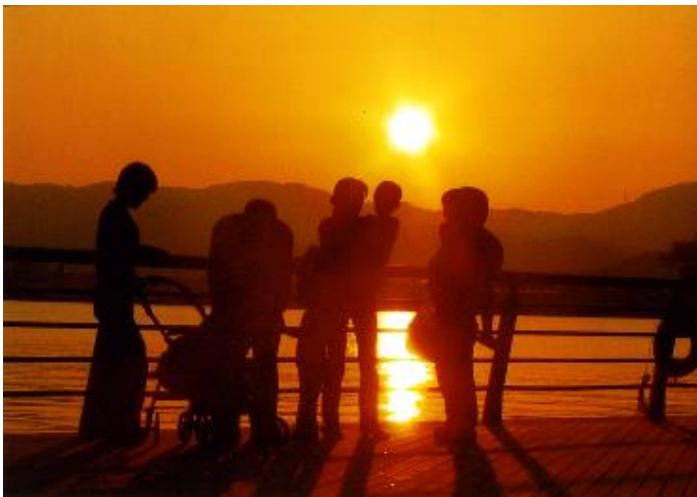
入選 「家族と一緒に」