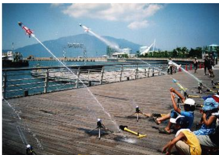
市長賞 「飛べ！ 僕のロケット」