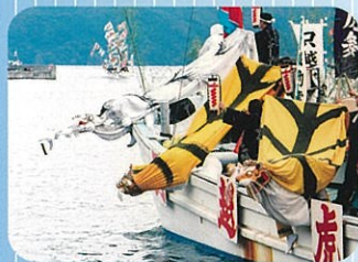
曳船まつり(釜石市)