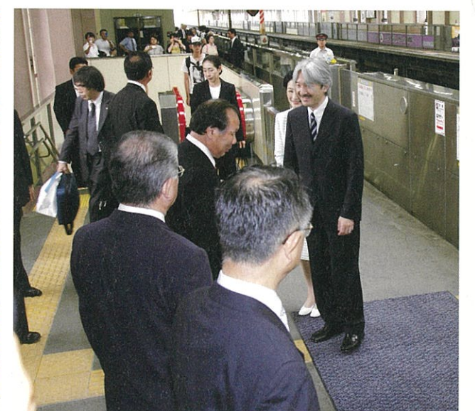
▲帰京される秋篠宮同妃両殿下（JR東日本水沢江刺駅）