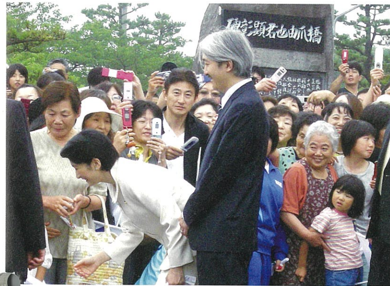
▲大船渡商工会議所前で市民にお話しされる秋篠宮同妃両殿下