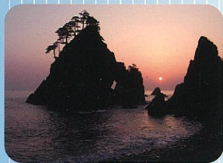
つりがね洞(久慈市)