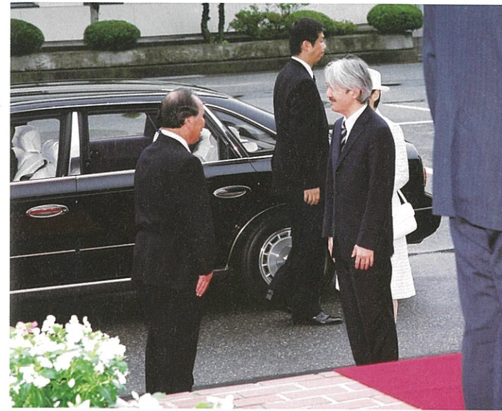
▲皇典御臨席の秋篠宮同妃両殿下のお迎えの様子（大船渡市民体育館）