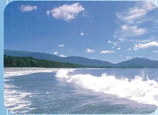
高田松原(陸前高田市)