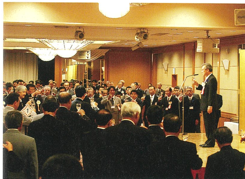
▲記念式典終了後に開催した記念祝賀会の様子