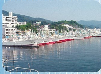
内湾の漁船係留風景(気仙沼市)