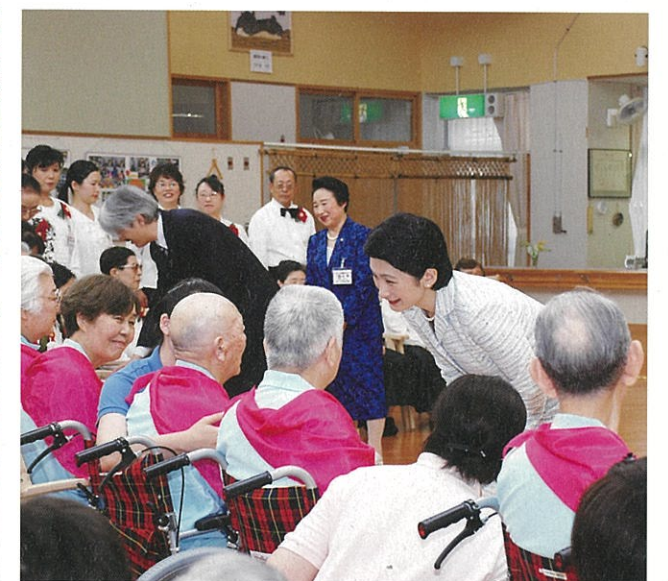
▲特別養護老人ホームの入所者にお声をお掛けになる秋篠宮同妃両殿下