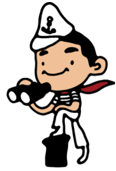
みなとミュージロー (みなとの博物館の案内人)