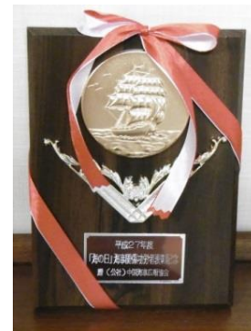
呉市海事歴史科学館（大和ミュージアム）表彰状と盾