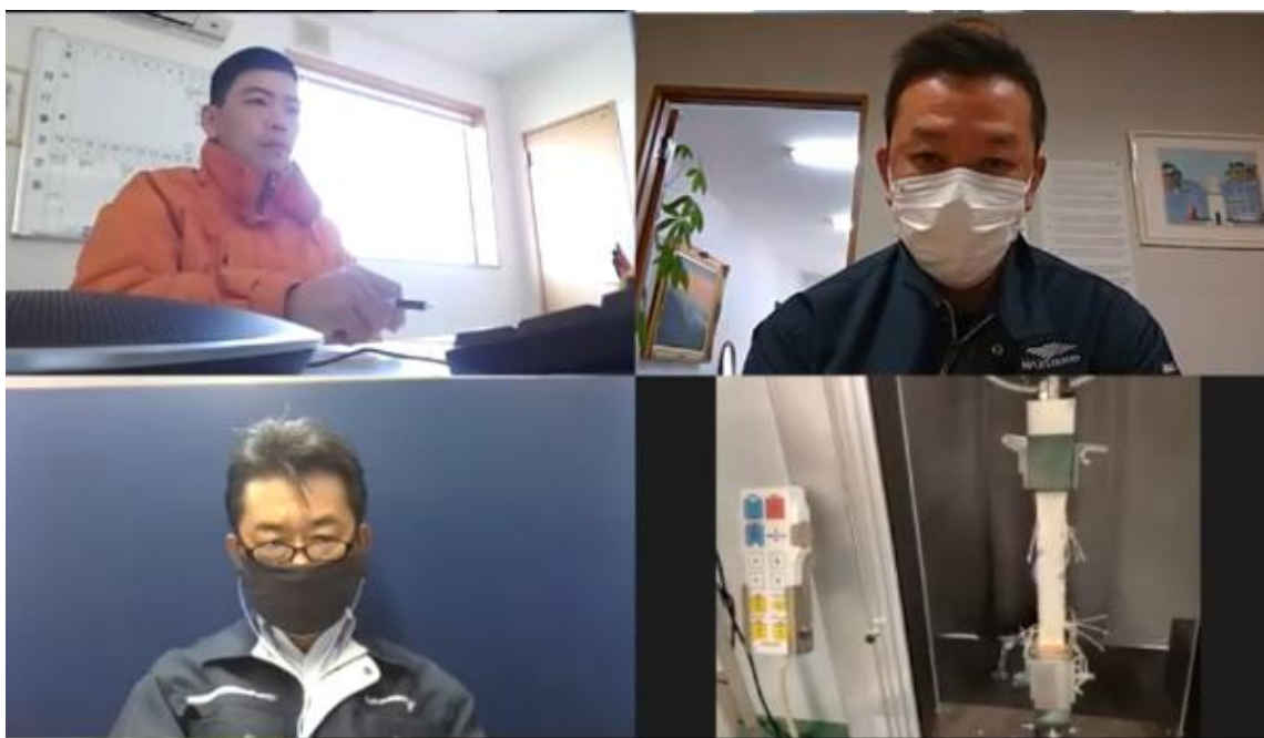
カーテン残存強度確認 引張試験状況 試験