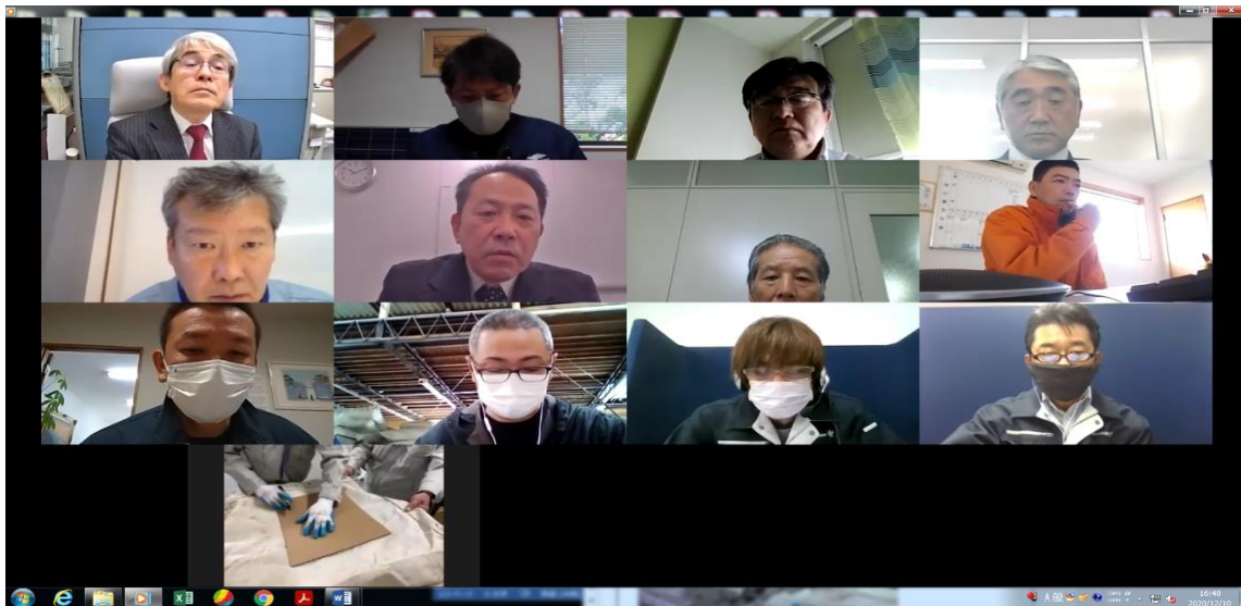
カーテン残存強度確認 試験供試体採取状況