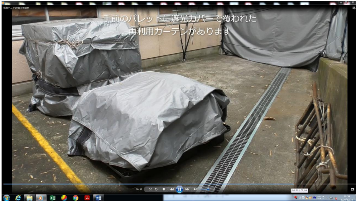
保管体制 保管状況チェック 屋外保管（遮光シート）