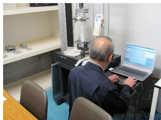
引張試験状況(右下)