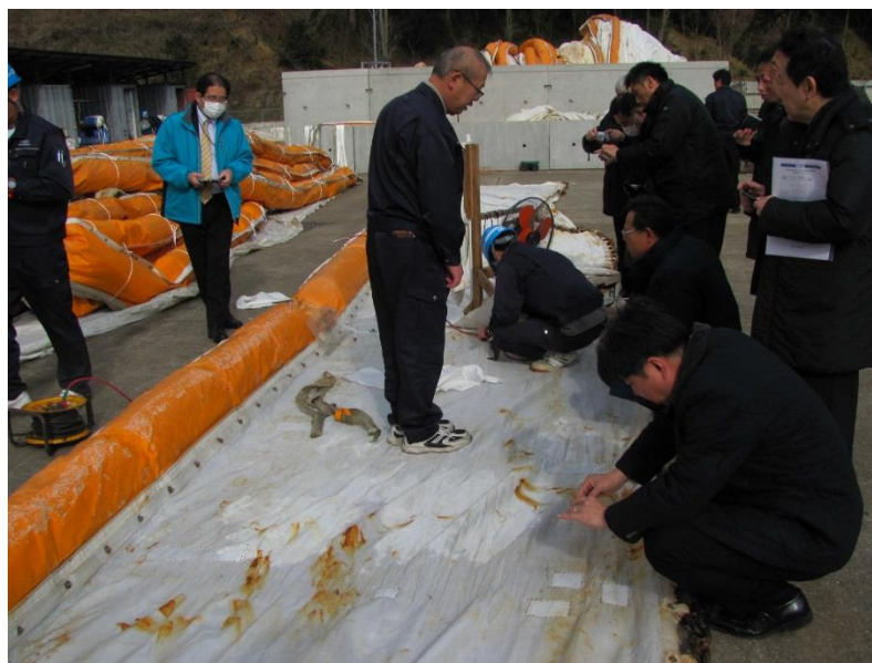
カーテン残存強度確認試料採取状況