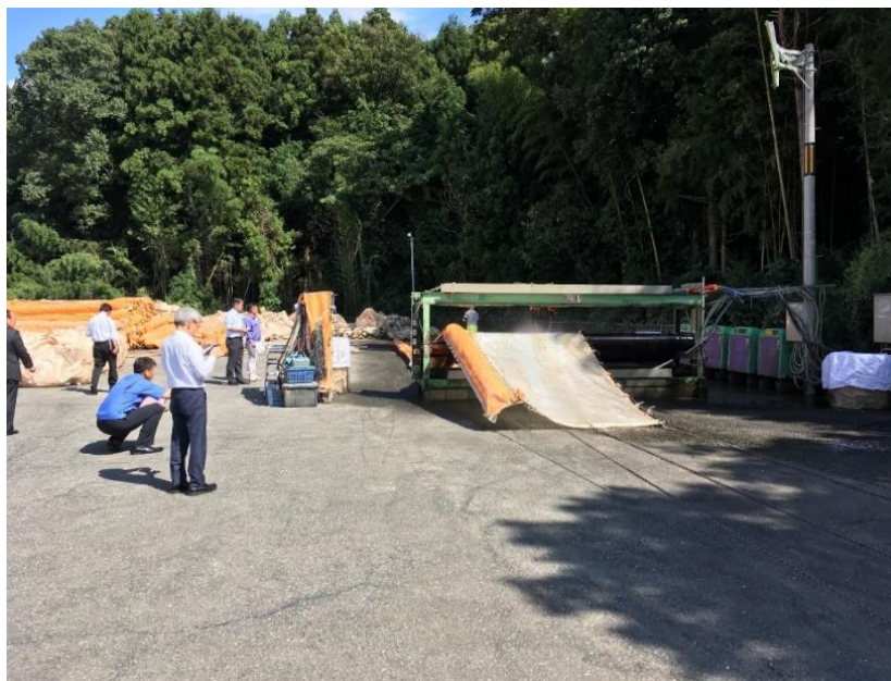
品質管理・整備状況チェック・洗浄工程