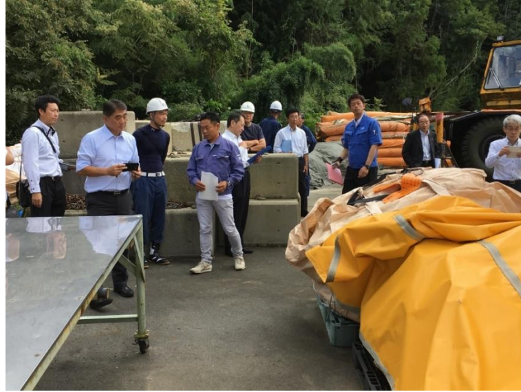
保管体制・保管状況チェック・遮光シートによる保護