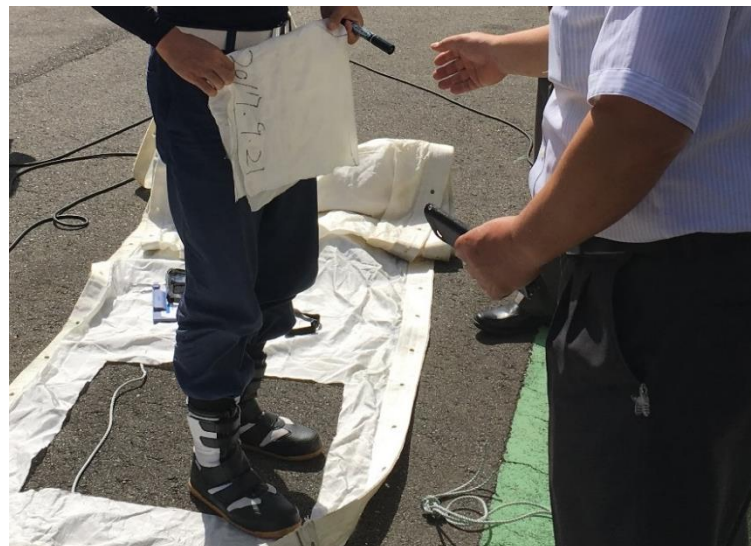
カーテン残存強度確認・試験供試体