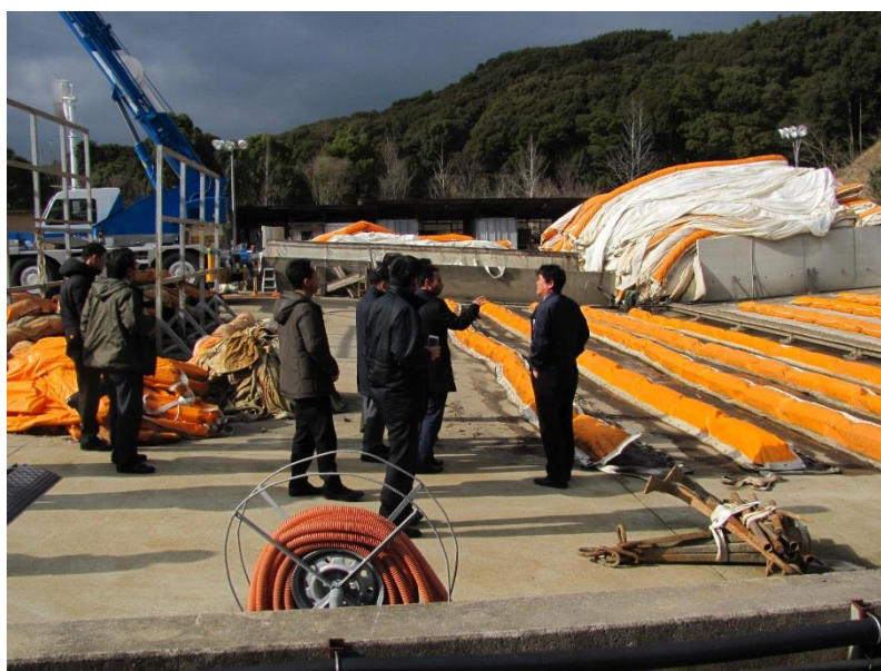
品質管理 ・ 整備状況チェック ・ 洗浄工程