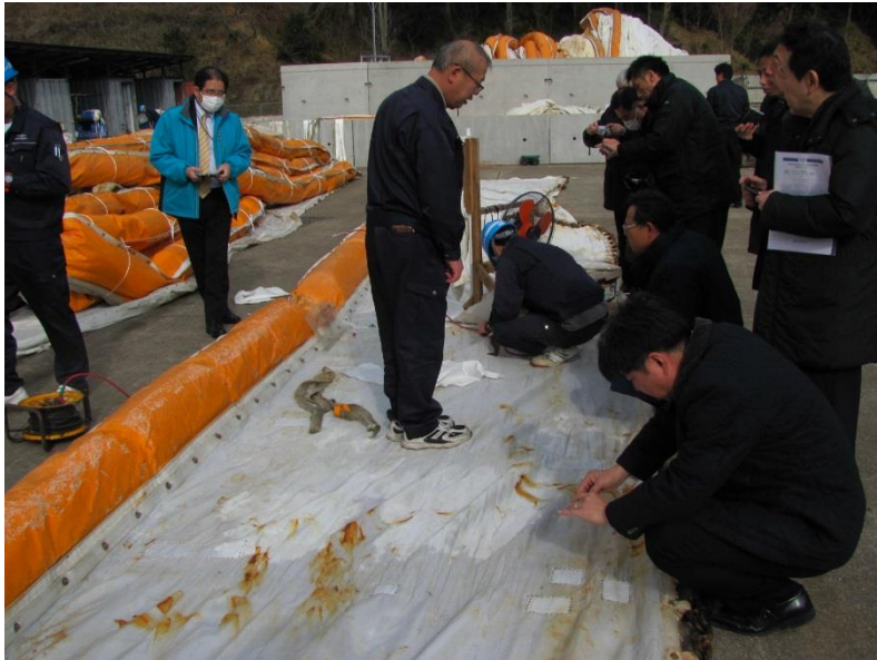
カーテン残存強度確認 ・ 試料採取状況