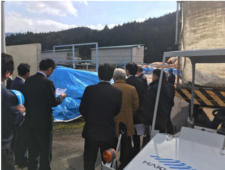
保管体制 ・ 保管状況チェック ・ 遮光シートによる保護