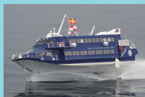
伊豆大島への高速ジェット船 セブンアイランド