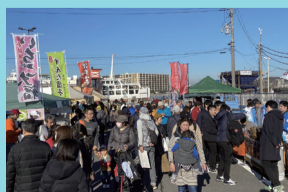
ペリーふ頭黒船朝市