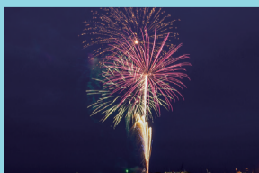
久里浜ペリー祭 (花火大会)