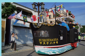
久里浜ペリー祭 (日米親善ペリーパレード)

地域最大のイベント、ペリー祭は毎年7月に開催。パレードや、式典を実施し3,000発以上の花火がクライマックスを飾ります。また、ペリーふ頭黒船朝市は、地元の商品だけでなく、「房総半島から出店者がフェリーに乗ってペリーふ頭に来航」をキーワードに、横須賀・房総半島の名産品が大集合。東京湾周遊特別クルーズでは、第二海堡や海ほたる、風の塔、羽田空港周辺を船で巡り、地上からでは見ることが出来ない景色を眺めることが出来ます。その他、伊豆大島への高速ジェット船の運航や、客船寄港時には、イベントなどを行っています。