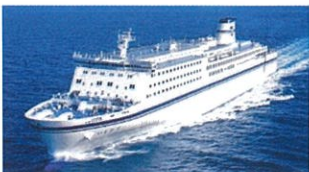
太平洋フェリー(いしかり)

仙台港には、苫小牧及び名古屋を結ぶ定期フェリー航路が就航しています。苫小牧とは毎日、名古屋とは隔日で運航されており、北海道と中部地方を繋ぐ交流拠点となっています。