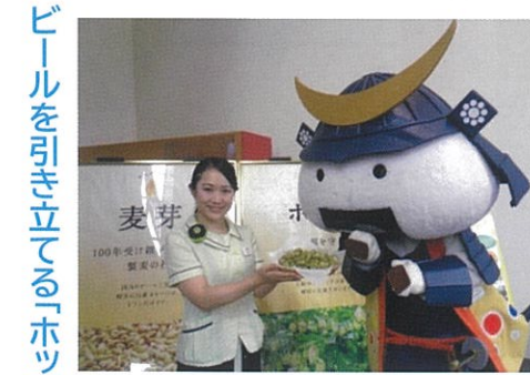
ビールを引き立てる「ホップ」