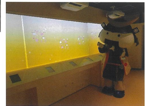
ビール酵母の働きで発酵が進む様子を体験。ビール醸造家の腕の見せ所なんだから！