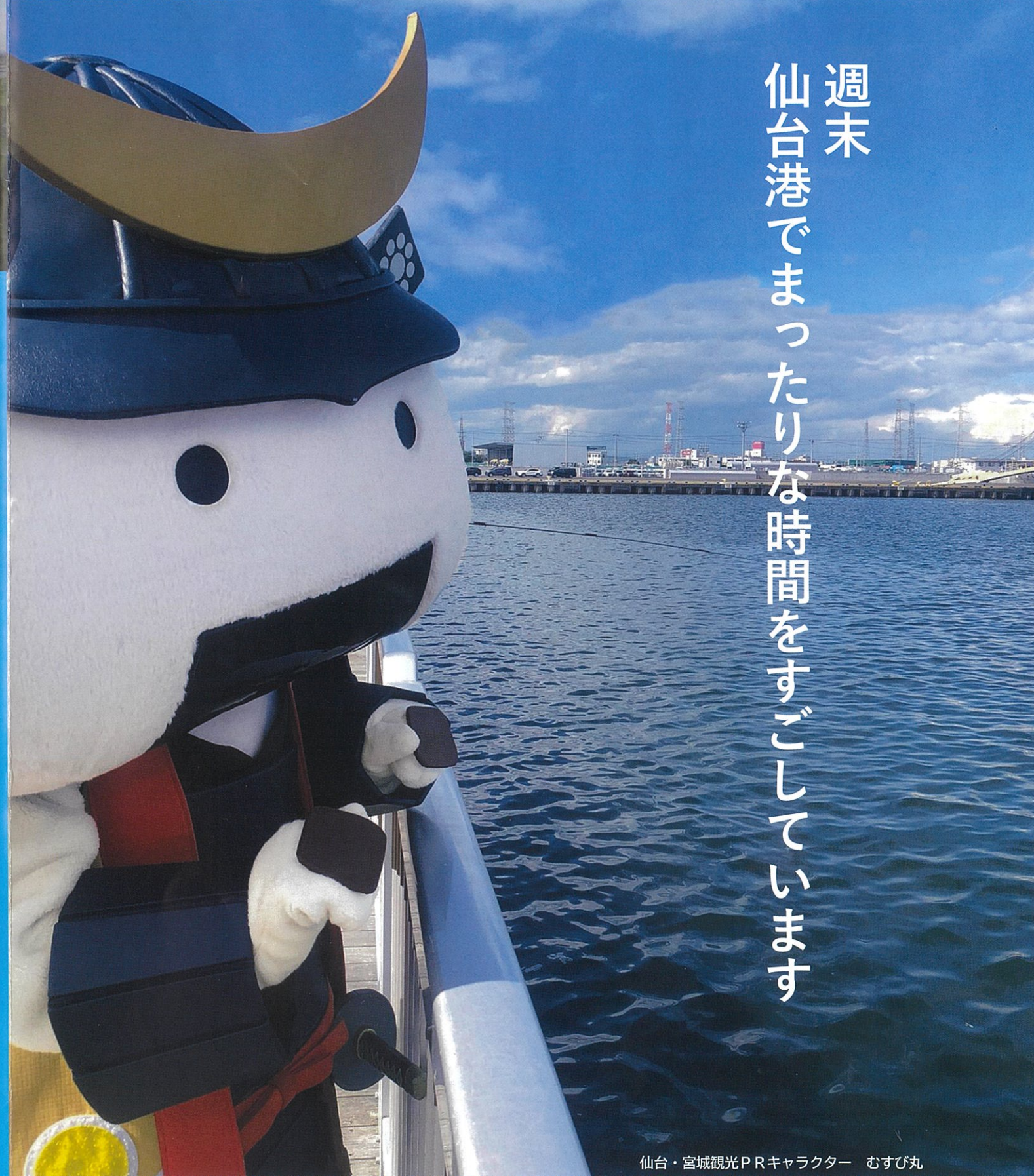
仙台・宮城観光PRキャラクター むすび丸