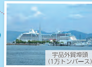
宇品外貿埠頭 (1万トンバース)