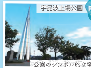
公園のシンボリックな塔