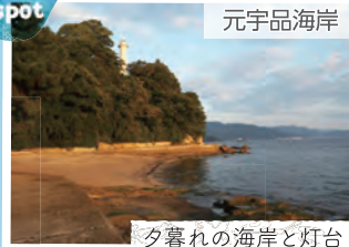
夕暮れの海岸と灯台