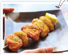
せとうち欲張り串

相性の良い牡蠣と味噌に、バター風味を加えて、味わい深く仕上げた一品。Sea級グルメ全国大会にも出品している。