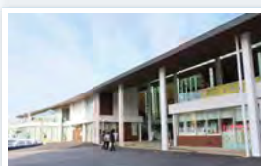
みなとオアシスみやじま・みやじまぐち 【宮島口旅客ターミナル】