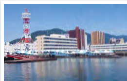
みなとオアシス三原 【三原港湾ビル】