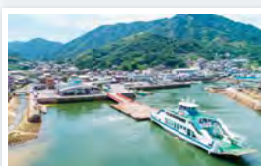
みなとオアシスみたか 【みたかゲートハウス】