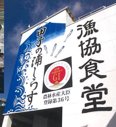
田子の浦港 漁協食堂

市場そのままの雰囲気の中、「田子の浦しらす」とともに、富士山と港の風景を味わうことができる漁協直営食堂です。ぷりぷりの生しらすや、ふっくらした釜揚げしらすを使った絶品のしらす丼が大人気。