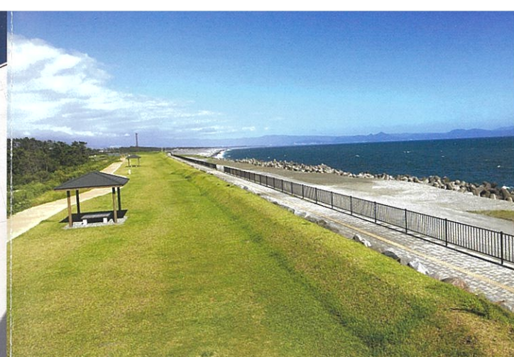
鈴川海浜スポーツ公園

市場そのままの雰囲気の中、「田子の浦しらす」とともに、富士山と港の風景を味わうことができる漁協直営食堂です。ぷりぷりの生しらすや、ふっくらした釜揚げしらすを使った絶品のしらす丼が大人気。