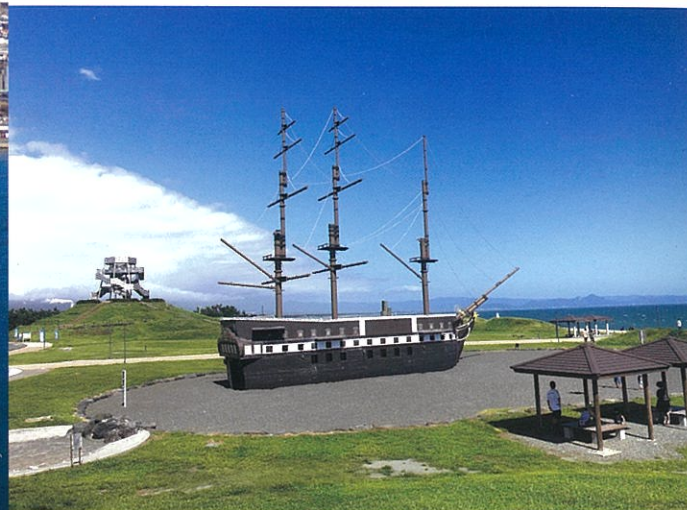
ふじのくに田子の浦みなと公園

富士山と駿河湾の絶景を望む展望施設「富士山ドラゴンタワー」や、船型の歴史学習施設「ディアナ号」がある緑地公園。お祭りやマルシェといったイベントも開催され、市民の憩いの場となっています。