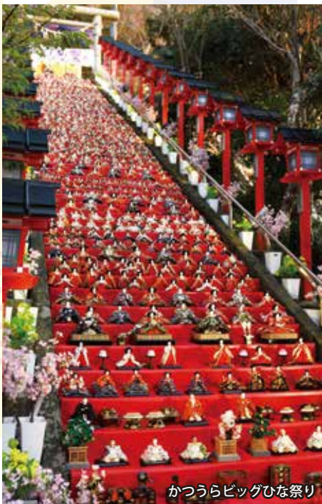
かつうらビッグひな祭り