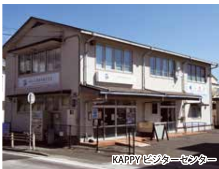
KAPPY ビジターセンター