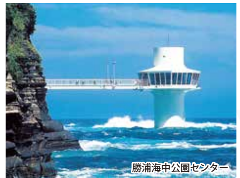
勝浦海中公園センター