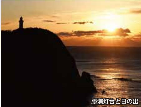
勝浦灯台と日の出