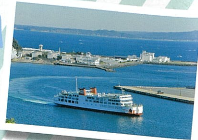
久里浜港とフェリー