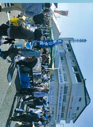
ペリーふ頭黒船朝市