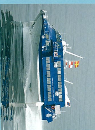
伊豆大島への高速ジェット船セゾライランド