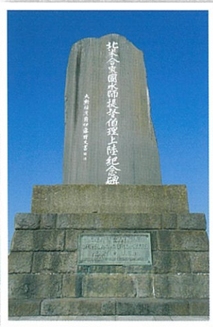
ペリー上陸記念碑