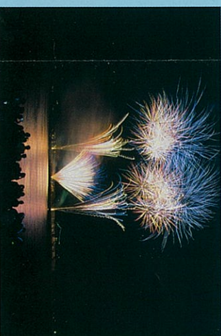
久里浜ペリー祭(花火大会)