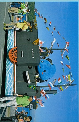
久里浜ペリー祭(日米親善ペリーパレード)

地域最大のイベント、ペリー祭は毎年7月に開催。パレードや、式典を実施し、3,000発以上の花火がライマツクスを飾ります。また、ペリーふ頭黒船朝市は、地元の商品だけでなく、「房総半島から出店者がフェリーに乗ってペリーふ頭に来航」をキーワードに、横須賀・房総半島の名産品が大集合。東京湾周遊特別クルーズでは、第二海堡や、海ほたる、風の塔、羽田空港周辺を船で巡り、地上からでは見られない景色を眺めることができます。その他にも、伊豆大島への高速ジェット船の運航や、客船寄港時には、ふ頭内でイベントなどを実施しています。