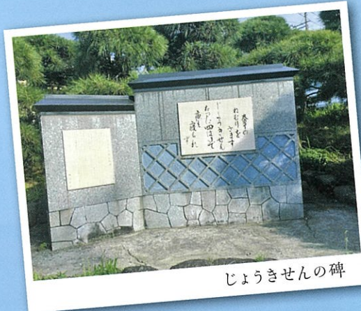
じょうきせんの碑