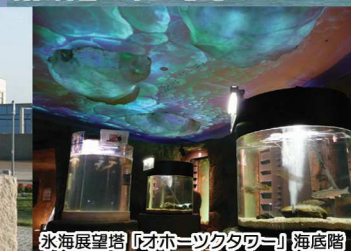
氷海展望塔「オホーツクタワー」海底階