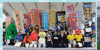
過去開催地の様子

毎年開催される全国大会には約20店以上のSea級グルメが出品され、投票によりその年No.1のグルメが決定します。そのほか、会場ではご当地の特色を活かしたステージイベントも実施。子どもからお年寄りまで、市内外から多くのお客様にお楽しみいただいています。