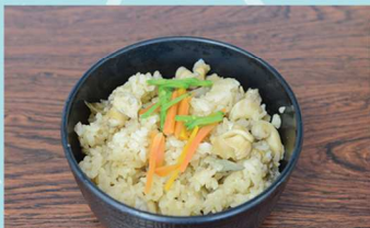
第10回大会 優勝 みなとオアシス魚津「魚津バイ飯」

みなとオアシスの地元産の海産物や、背後地域の名産品を用いてつくられ「ぜひ多くの人に味わってほしい」と自信を持っておすすめできる飲食物です。飲食物には何らかの「Sea(海)」の要素を含みます。