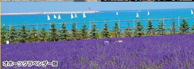
オホーツクラベンダー畑