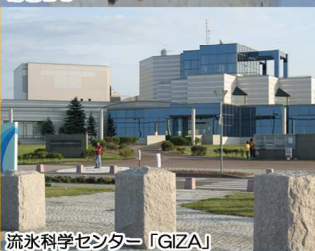
流水科学センター「GIZA」