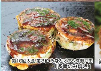
第10回大会 第3位 みなとオアシス瀬戸田 「多幸のみ焼き」