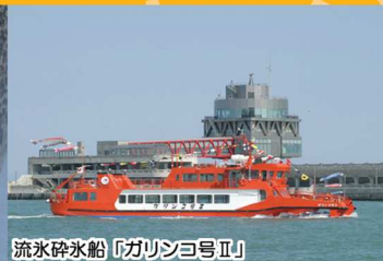
流水砕氷船「ガリンコ号Ⅱ」