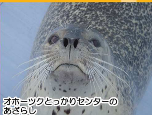
オホーツクとっかりセンターのあざらし

イベント会場の周辺には紋別を代表する観光施設がたくさん!夏は釣りクルーズができるガリンコ号Ⅱや、海中を観察できるオホーツクタワー、アザラシとふれ合うことができるとっかりセンターなど、オホーツクならではの体験ができる施設があります。Sea級グルメでお腹を満たしたら、カリヤ地区でオホーツクの魅力を満喫しよう!