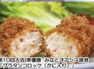
第10回大会 準優勝 みなとオアシス境港 「グルテンコロッケ (かに入り)」

毎年開催される全国大会には約20店以上のSea級グルメが出品され、投票によりその年No.1のグルメが決定します。そのほか、会場ではご当地の特色を活かしたステージイベントも実施。子どもからお年寄りまで、市内外から多くのお客様にお楽しみいただいています。