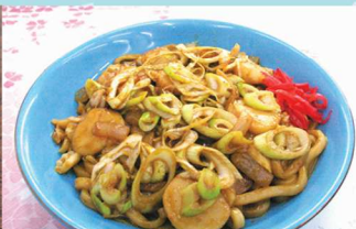
みなとオアシスもんべつ 「ホタテみそ焼きうどん」