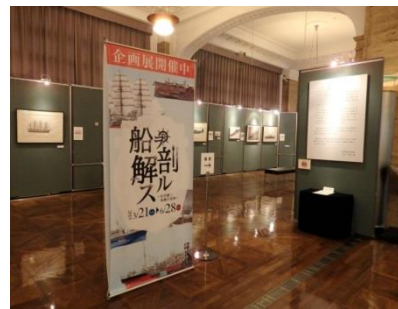
日本郵船歴史博物館 企画展「船ヲ解剖スル」 ～谷井建三原画の世界～