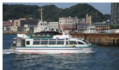
関門海峡クルージング