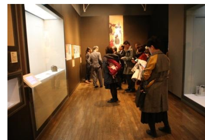
長崎歴史文化博物館