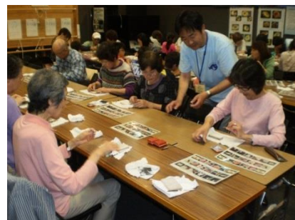
館山市立博物館分館 “渚の駅”たてやま 渚の教室