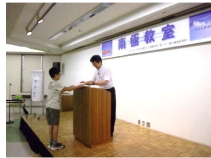
名古屋海洋博物館 第12回南極教室