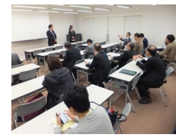
長崎歴史文化博物館にて研修