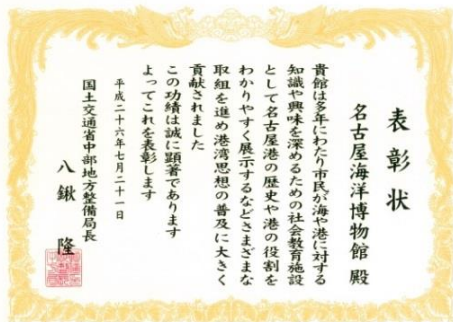
表彰状 名古屋海洋博物館