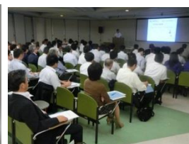
名古屋海洋博物館