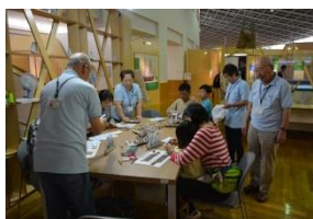
平成26年度実施事業 横浜みなと博物館