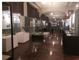
日本郵船歴史博物館