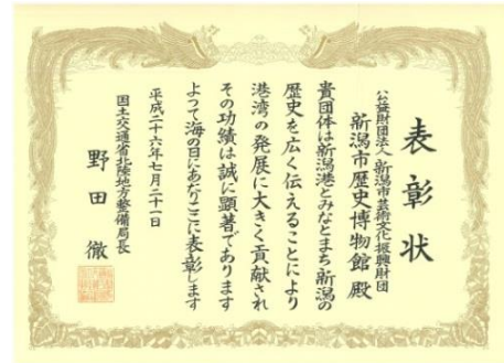
新潟市歴史博物館