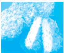
愛媛県 八幡浜市 八幡浜港 みなとオアシス (八幡浜港)

地元水揚げのハモエキスたっぷりの炊き込みご飯、さらにかば焼きまで乗せた、豪華ハモづくし丼ぶり。