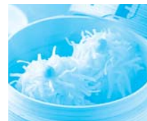
佐賀県 唐津市 みなとオアシス からつ(唐津港)