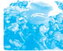
岡山県 玉野市 みなとオアシス 宇野(宇野港)

日本海に浮かぶ孤島、隠岐の島のきれいな海で育ったさざえを使った伝統料理「さざえの混ぜご飯」です。今回は隠岐藻塩米(商標登録)を使っています。