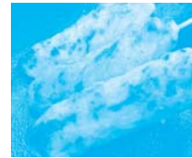
山形県 酒田市 みなとオアシス 酒田(酒田港)

日本一の水揚げを誇る北海道一苫小牧ならではのおふくろの味、ほっきカレー。苫小牧名産のほっき貝と北海道産の新鮮なアスパラを乗せた人気メニューです。