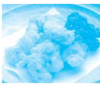
大分県 大分市 みなとオアシス かんたん港園 (大分港)