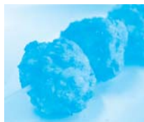
広島県 三原市 みなとオアシス 三原(尾道糸崎港)