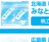
北海道 稚内市(稚内港) みなとオアシスわかない