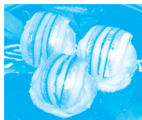
高知県 宿毛市 みなとオアシス 宿毛(宿毛湾港)