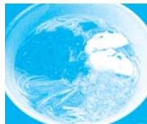
広島県 呉市 みなとオアシス 蒲刈(蒲刈港)