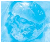
広島県 竹原市 みなとオアシス たけはら(竹原港)