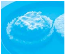
北海道 網走市 みなとオアシス 網走(網走港)