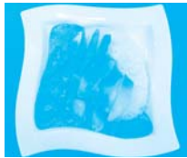
北海道 苫小牧市 みなとオアシス 苫小牧(苫小牧港)

肉質がやわらかく脂乗りも抜群!ビタミンDを豊富に含む「オホーツクサーモン」ことカラフトマスを使ったライスバーガーです。