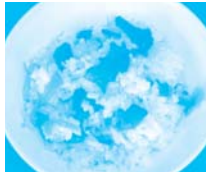
島根県 隠岐郡隠岐の島町 風待ち西郷・ みなとオアシス (西郷港)