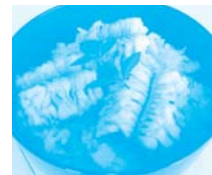
山口県 防府市 みなとオアシス 三田尻(三田尻中間港)

海人の藻塩を使ったこしのある藻塩めんに、たこかまぼこをあしらった蒲刈島オリジナルぐるめ。