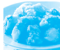
広島県 竹原市 みなとオアシス ただのうみ (忠海港)

たこのまち三原の定番といえば「たこ天」と「たこ飯」にニューフェイスの「たこだんご」デビュー!! 天下一品の三原のたこをご堪能ください。